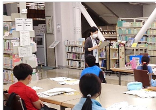
図書館活用講座の様子